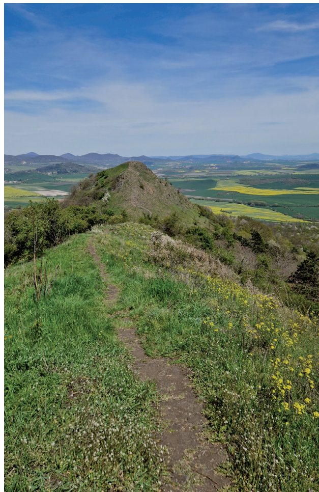
Ein Pfad führt über den langen Grat des Srdov.

Wir steigen auf dem steilen Pfad zurück in den Sattel und beginnen den Aufstieg zu unserem nächsten Ziel. Der Pfad verläuft zunächst in schütterem Laubwald mit einigen Lärchen und Kiefern in angenehmer Steigung aufwärts. Nachdem wir den Hangwald verlassen haben, schauen wir zurück auf den Brník und folgen nun für etwa 200 m dem schmalen Gratweg über den Srdov bis zu dessen kaum wahrnehmbaren höchsten Gipfel (482 m). Interessant ist der Unterschied zwischen der schütter mit Sträuchern bewachsenen Nordwestflanke und der gehölzfreien, nur