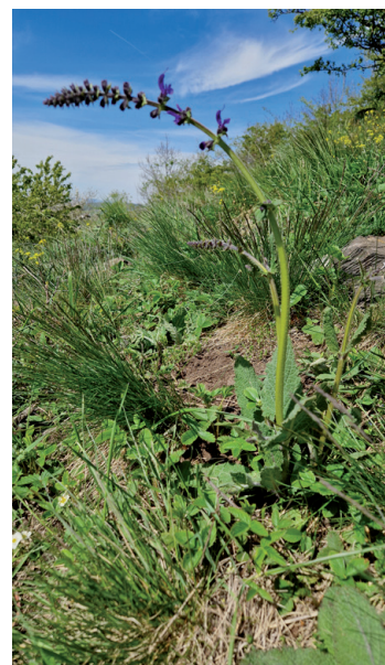
Tier- und Pflanzenwelt auf den Steppenbergen: Segelfalter, Bleicher Schöterich und Wiesensalbei