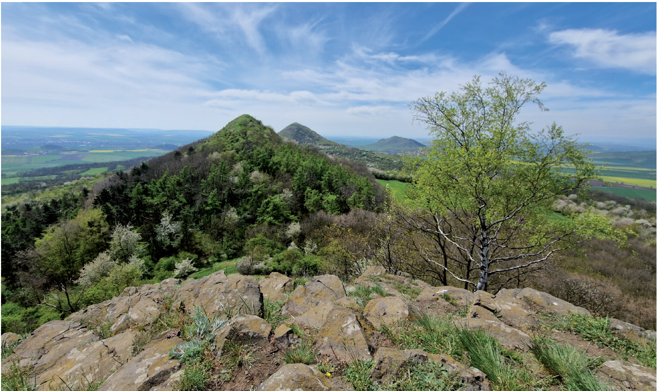
Blick vom Gipfel des Brník zu den Steppenbergen Srdov, Oblík und Raná

Der günstigste Zeitpunkt für diese Tour ist ab Ende April bis Mitte/Ende Mai. Zu dieser Zeit stehen anfangs die wilden Kirsch- und Birnenbäume sowie die Schlehen in voller Blüte, verströmen einen süßen Duft und schaffen einen Kontrast zu den zartgrünen Blättchen der Gehölzstreifen aus Heckenrose-, Weißdorn-, Holunder-, Pfaffenhütchen-, Haselnuss- und Hartriegelsträuchern, während die darüber hinausragenden Eschen und Ahornbäume noch kahl sind. Im Mai blühen vor allem seltenen Steppenpflanzen und die Federgräser wogen im Wind.