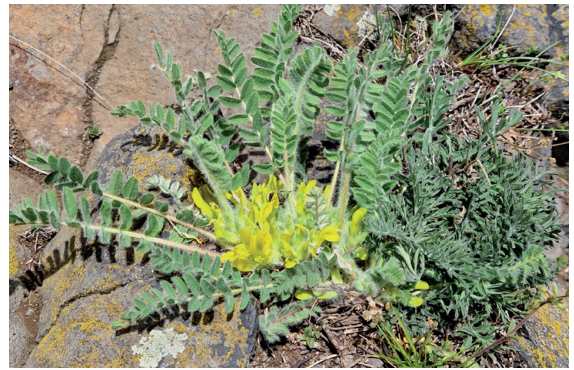
Besonders gut zu finden entlang des Pfades auf der Westseite des Srdov: Stängelloser Tragant

Danach wandern wir sanft absteigend bis in den Sattel zwischen Srdov und Oblík. Dort treffen wir auf den breiten Wanderweg mit der grünen Markierung und biegen nach links ab. Achtung! Bereits nach reichlich 50 m verlassen wir an einer Kreuzung den breiten Weg und folgen der grünen Markierung scharf nach rechts. Nun beginnt der Anstieg auf den letzten unserer Steppenberge. Wer nun gedacht hat, dass der Oblík in Bezug auf die Pflanzenwelt der Steppenberge nichts Neues mehr zu bieten hätte, liegt falsch. Der Oblík