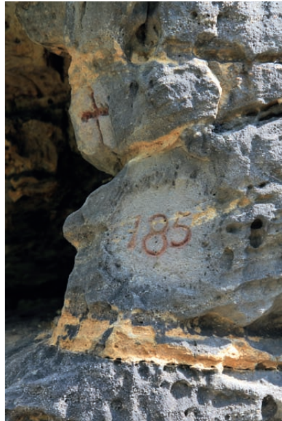
Forstgrenzzeichen mit der Nummer 185 am Felsfuß unterhalb des Eislochs

Kurz darauf ist links noch die Nummer 164 erkennbar, dann mündet unser Pfad in einen breiteren Waldweg, den Lattenweg. Diesem folgen wir abwärts bis ins Tal, wo sich eine Schutzhütte mit Rastbank befindet. Außerdem sollten