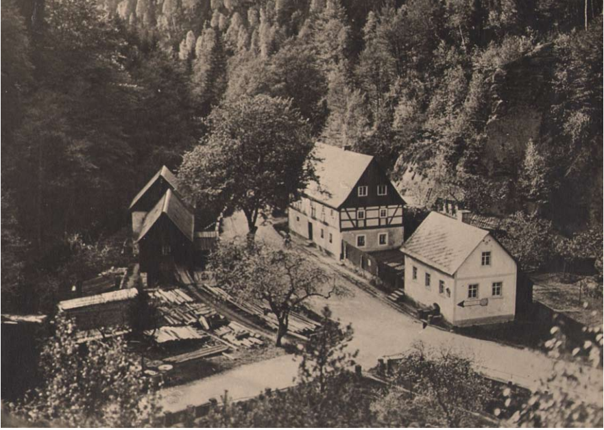
Neumann-Mühle, Foto etwa 1940