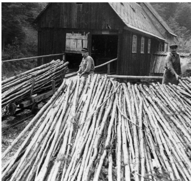
Das Stangenholz wurde in der Neumann-Mühle zu Holzschliff verarbeitet. Foto um 1940

Bis zum Bau der Straße durch das Kirnitzschtal in den Jahren 1872/74 war der Abtransport der in der Mühle geschnittenen Hölzer sehr mühsam. Wie im „Mühlen-